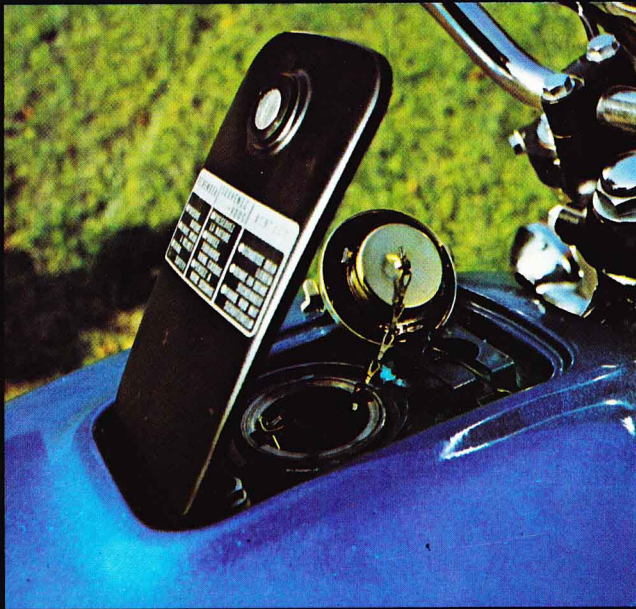
Der Tankdeckel liegt unter einer verschließbaren Abdeckung, die mit dem Zündschlüssel zu öffnen ist.