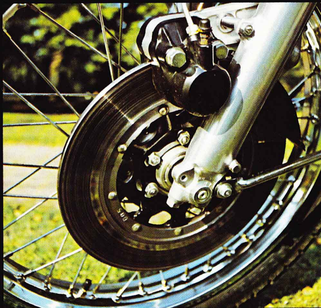
Die hydraulische Scheibenbremse vorn, erhöht die Fahr-sicherheit.