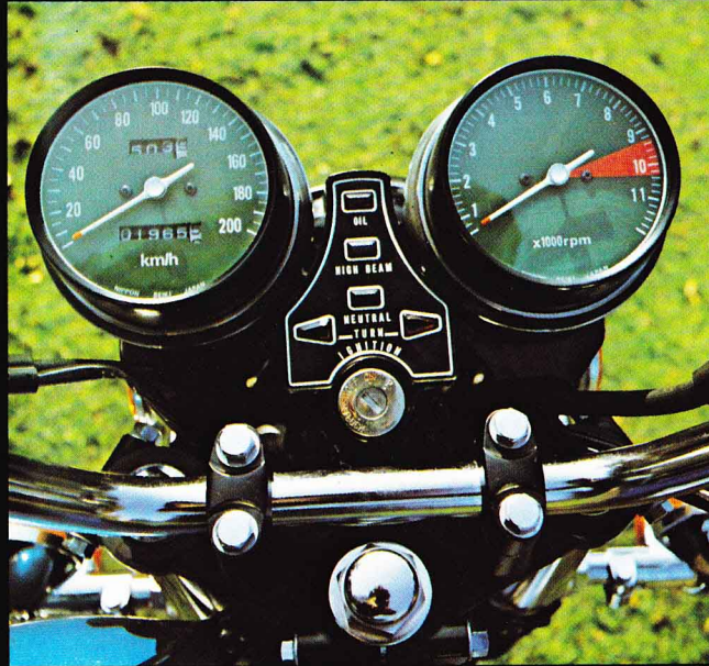
Die großen und damit sehr übersichtlichen Rundinstrumente sind Tag und Nacht gut ablesbar. Das Zündschloß befindet sich innerhalb der Kontrolleuchtenkonsole.