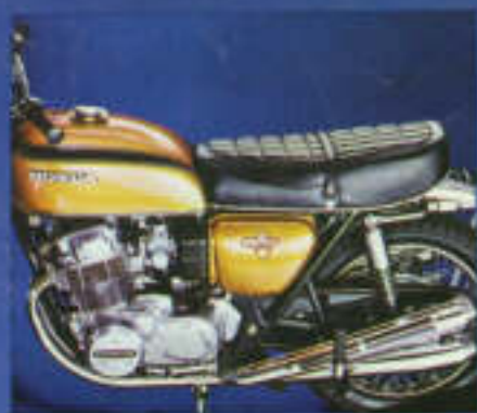
Technische Daten Modell CB 750 Four